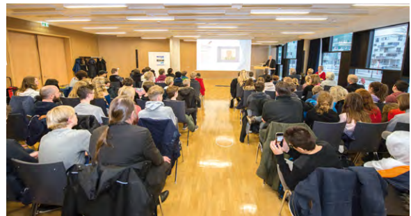
Preisverleihung in der Behörde für Stadtentwicklung und Wohnen

Mit dem Wettbewerb will die Kammer junge Menschen für Naturwissenschaft und Technik begeistern. Der Schülerwettbewerb, der in Hamburg unter der Schirmherrschaft vom Präses der Behörde für Schule und Berufs-